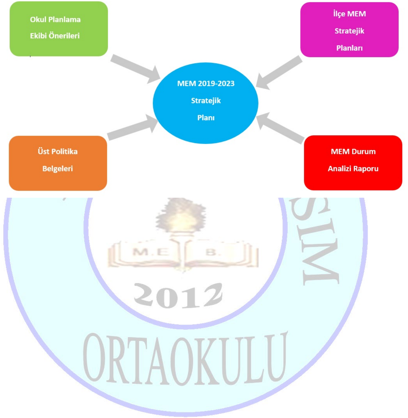
Şekil 1: Plan Oluşum Şeması